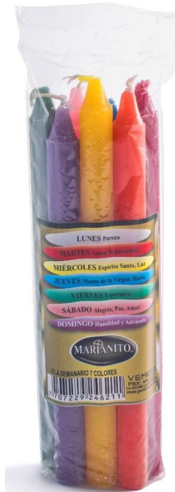
VELA SEMANARIO*7 (20) 7707229246211