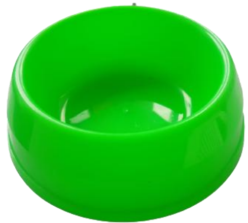
COMEDERO REDONDO GRANDE MAXKOTAS (12) 7707229243555