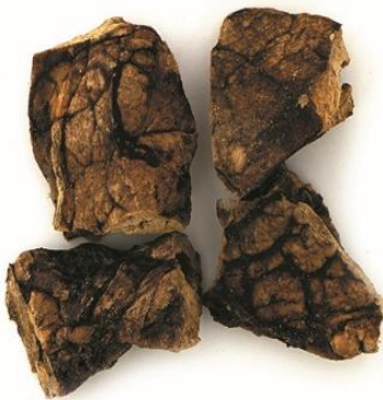
SNACK NATURAL PULMÓN*4 UND MAXKOTAS (12) 7707229246396