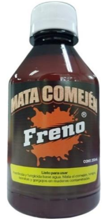
INMUNIZANTE MATA COMEJEN 250ML (25) 7707229412425