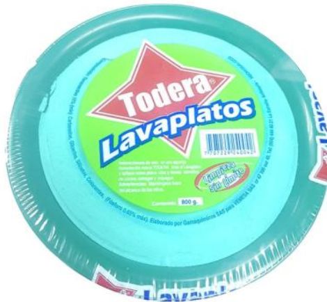
LAVAPLATOS 800GR ORIGINAL(24) 7707229248529