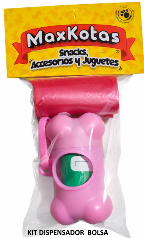
KIT DISPENSADOR BOLSA DESECHABLE MAXKOTAS+2 ROLLOS*20UN (50) 7707229247812