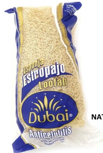
ESTROPAJO NATURAL*18CM (4)(60) 7707229246051