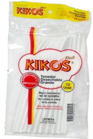
TENEDOR*12UDS DESECHABLE GRANDE (50) 7707229241445