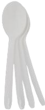
CUCHARA*12UDS DESECHABLE GRANDE (50) 7707229241438