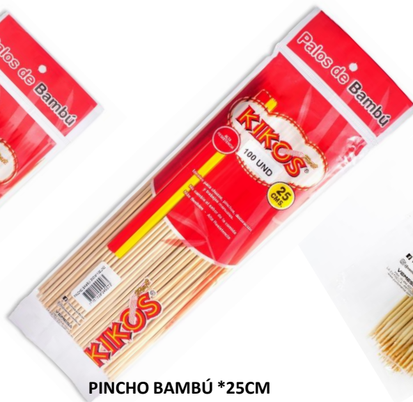
PINCHO BAMBÚ *25CM BOLS*100UND (25) 7707229245573