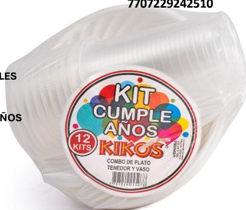
KIT CUMPLEAÑOS*12UND (36) 7707229245078