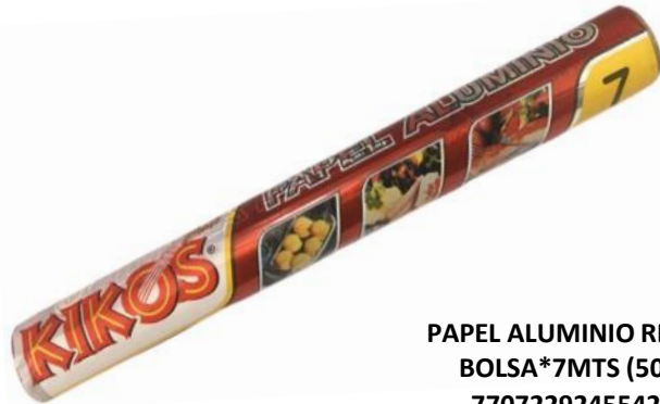
PAPEL ALUMINIO RPTO BOLSA*7MTS (50) 7707229245542