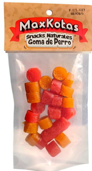
GOMA PERRO MAXKOTAS *75 GR (12) (96) 7707229241780