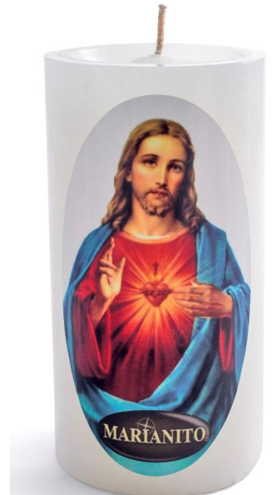
VELÓN*445 GR #12 13,5 X 7 CM (22) 7707229249182