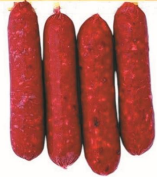
SALCHICHAS CARNAZA MAXKOTAS*4 UND (12) (240) 7707229241575