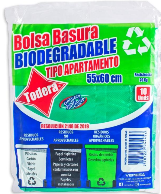
BOLSA BIODEGRADABLE APARTAMENTO 55*60CM VERDE*10 (50) 7707229244453