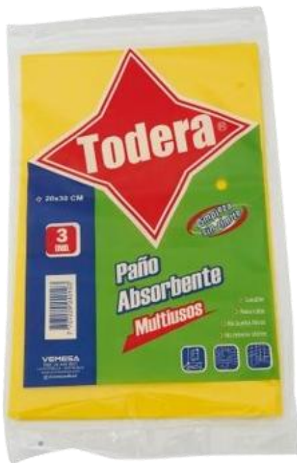
LIMPIÓN ABSORBENTE*3UND (24) 7707229240103