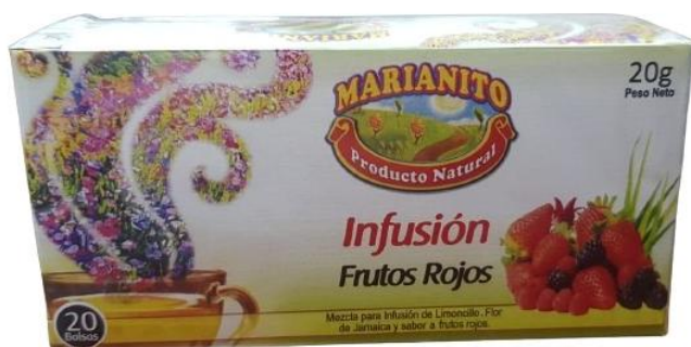
INFUSIÓN FRUTOS ROJOS 20 BOLSAS (12)(288) 7707229245429