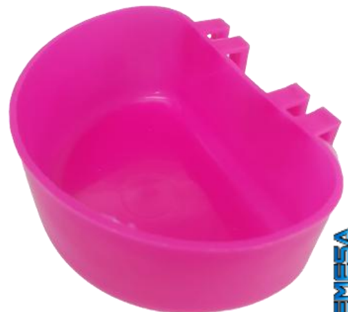
COMEDERO AVE MEDIA LUNA MAXKOTAS(50) 7707229241704