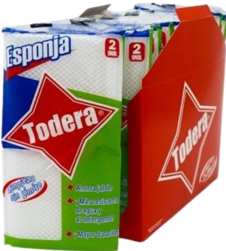
ESPONJA TODERA MALLA *2 UND (8) (48) 7707229240134