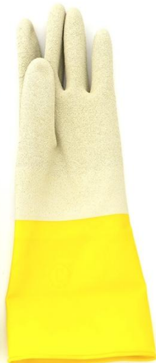
GUANTE CORRUGADO (12) (144)

T7 7707229240479 T8 7707229240486 T9 7707229240509