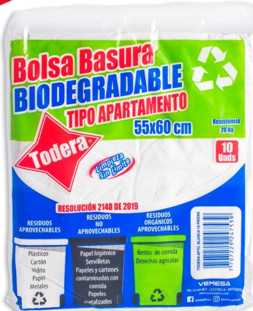
BOLSA BIODEGRADABLE APARTAMENTO 55*60CM BLANCA*10 (50) 7707229247539