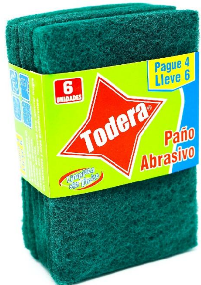
PAÑO ABRASIVO TODERA PAGUE 4 LLEVE 6 (30) 7707229240332