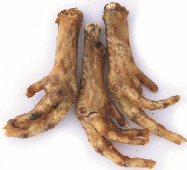
SNACK NATURAL PATA DE POLLO *3 UND MAXKOTAS (12) 7707229248369