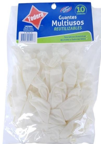
GUANTE MULTIUSOS LÁTEX*10 (30) 7707229242176

T7 7707229240479 T8 7707229240486 T9 7707229240509