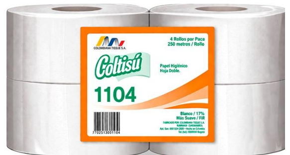
01TISS003 PAPEL HIGIENICO 2 HHOJAS 250 MT *4