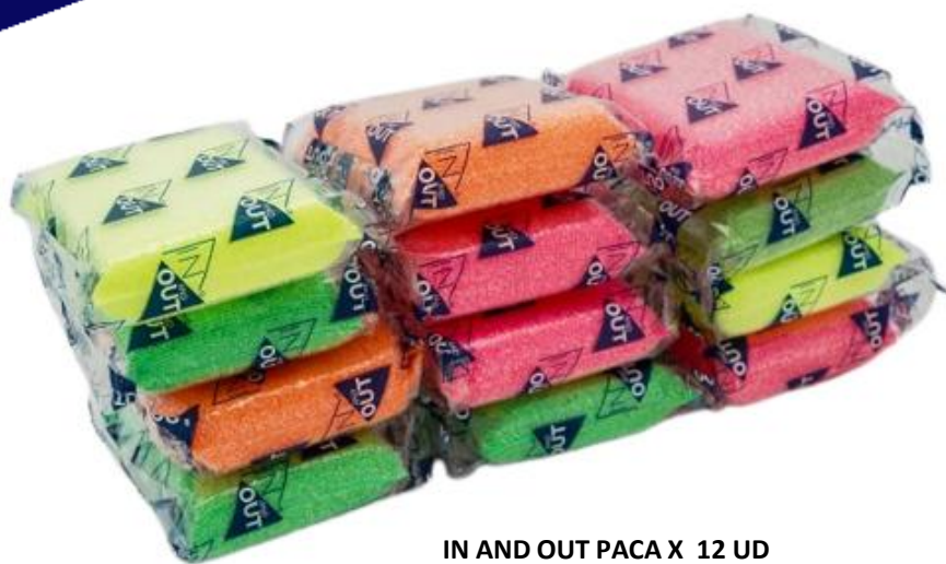
IN AND OUT PACA X 12 UD ESPONJA TORNASOL 17707229243026