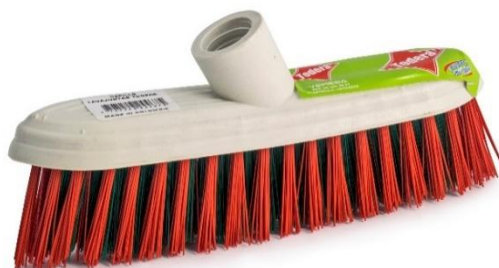
CEPILLO LAVAJUNTAS (48) 7707229244675