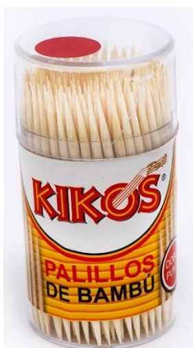
PALILLO BAMBÚ DOBLE PUNTA TARRO*180UND (24)(288) 7707229245634