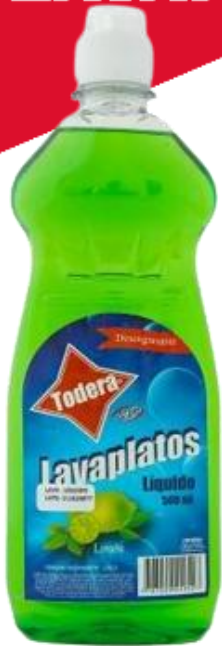
LAVAPLATOS LÍQUIDO*500ML (24) 7707229242527