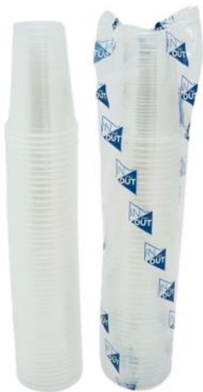
VASO 7oz *50 UDS IN AND OUT(60) 7707229248628