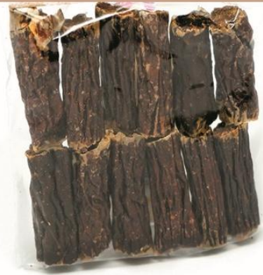
CÁBANOS MAXKOTAS*12 UND (12) 7707229241636