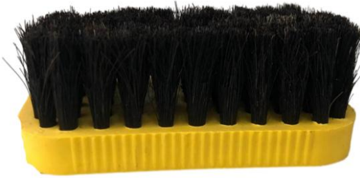
CEPILLO BETUNERO MEDIANO TODERA(12) 7707229242305