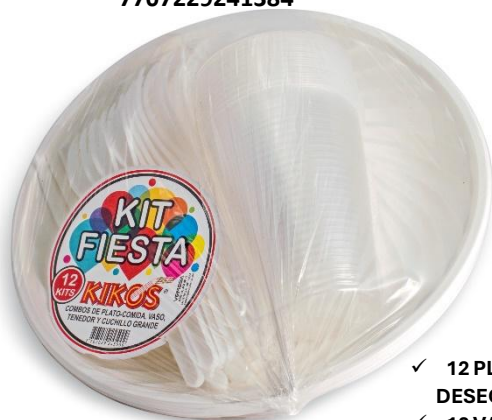
KIT FIESTA*12 UND (36) 7707229245009