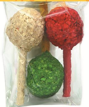
COLOMBINA CARNAZA MAXKOTAS*3UN (12) (240) 7707229241834