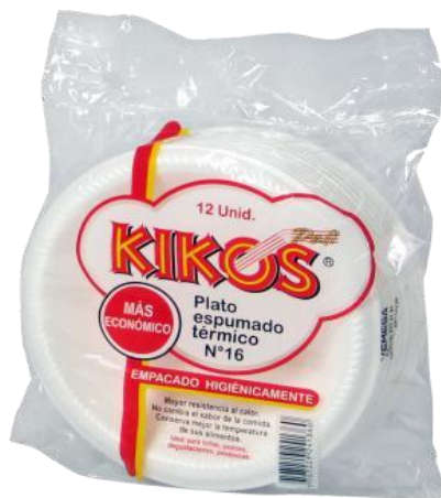
PLATO ESPUMADO #16 PANDO*12 UND (30) 7707229241360