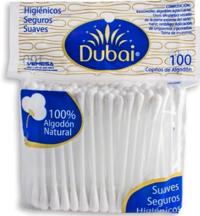
BOLSA COPITO DUBAI *100 UND PAPEL(26) 7707229246112