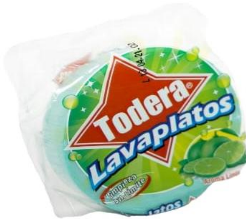
LAVAPLATOS *350gr RPTO AROMA LIMÓN (66) 7707229242893