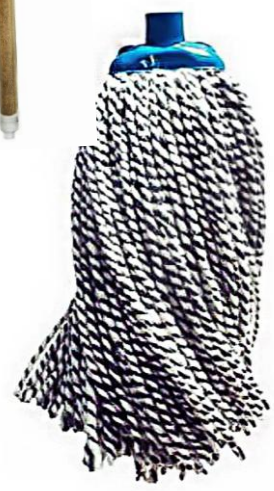
TRAPERO PABILO REPUESTO COLOR *250GR (12) 7707229247201