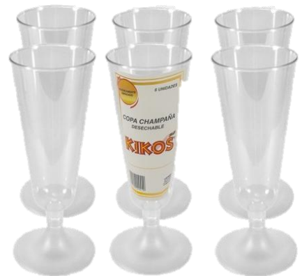
COPA DE VINO DESECHABLE TIPO FLAUTA*6UND (27) 7707229249410