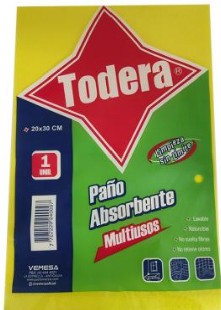
LIMPIÓN ABSORBENTE*1UND 20x30 (48) 7707229240097