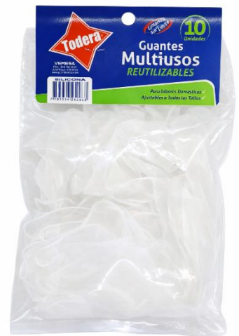
GUANTE MULTIUSOS VINILO SILICONA *10 UND(30) 7707229242633