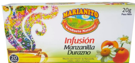
INFUSIÓN MANZANILLA DURAZNO*20 BOLSAS (12)(288) 7707229242862