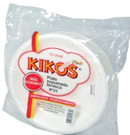
PLATO ESPUMADO #23 PANDO*12UND (30) 7707229241391