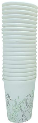
VASO CARTÓN ECOLÓGICO 4OZ*20UND (40) 7707229248093