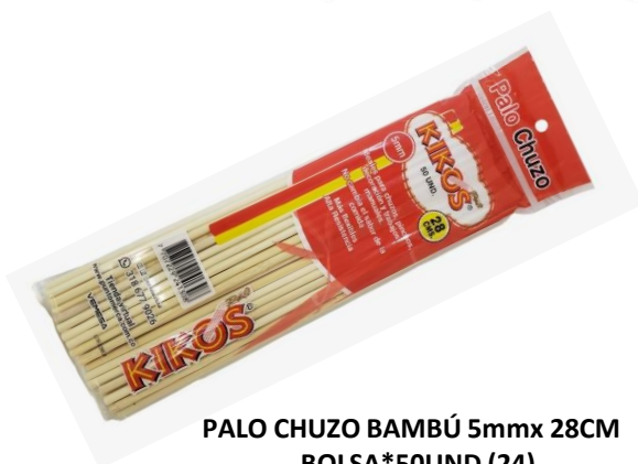
PALO CHUZO BAMBÚ 5mmx 28CM BOLSA*50UND (24) 7707229241308