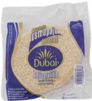
ESTROPAJO ESPUMA 12X8CM (8)(120) 7707229246068