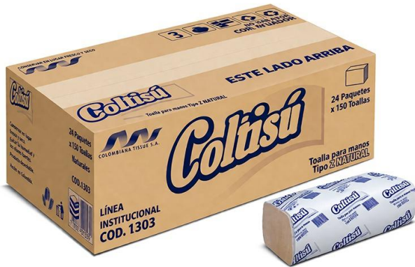
01TISS001 TOALLA EN Z NATURAL 2 HOJAS 150(24)