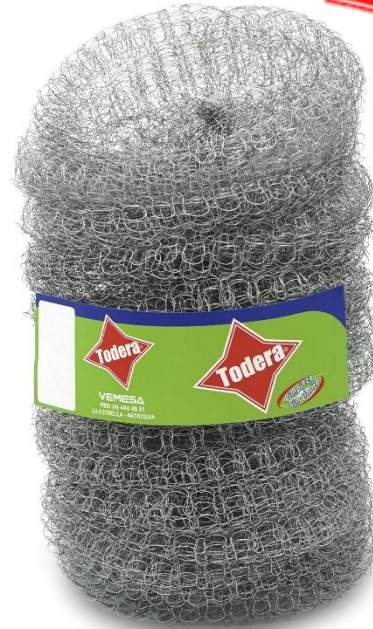
ESPONJA ALAMBRE ROLLO*18UND (72) 7707229246822