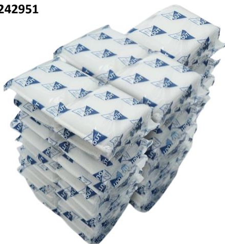
IN AND OUT PACA X 50 UD ESPONJA MALLA X 2 17707229243187