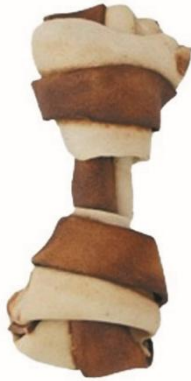
HUESO CARNAZA MAXKOTAS *1 UND (12) (300) 7707229241544