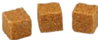
CUBO PANELA MARIANITO FRUTOS ROJOS*24 (80) 7707229248482