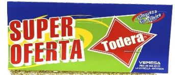
OF PE ESPONJA DORADA/PLATA+ POLIETILENO (60) 7707229242596