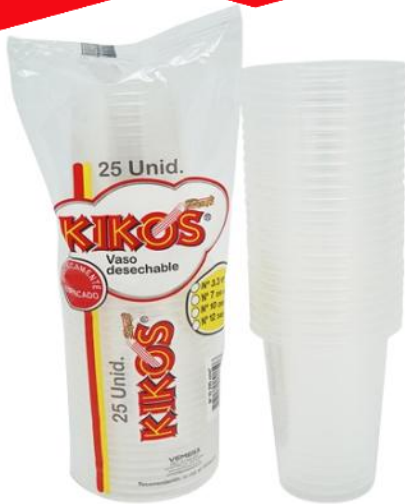
VASO DESECHABLE 10oz KIKOS*25UND (80) 7707229241506