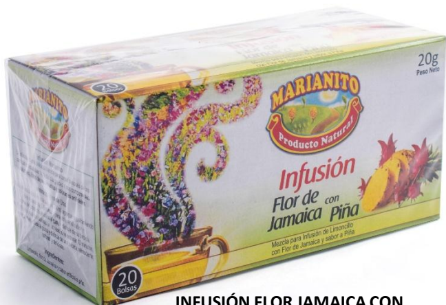
INFUSIÓN FLOR JAMAICA CON PIÑA 20 BOLSAS (12)(288) 7707229247164