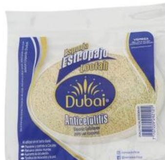
ÓVALO ESTROPAJO 13.5X9.5CM (20)(200) 7707229242121