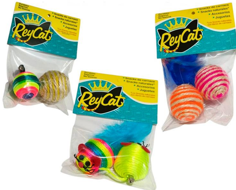
JUGUETE DE GATO SURTIDO REYCAT (12) 7707229247232