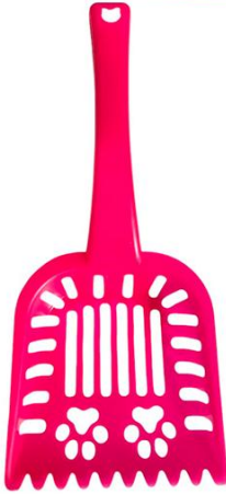
PALA ARENERA REYCAT (12) 7707229247805