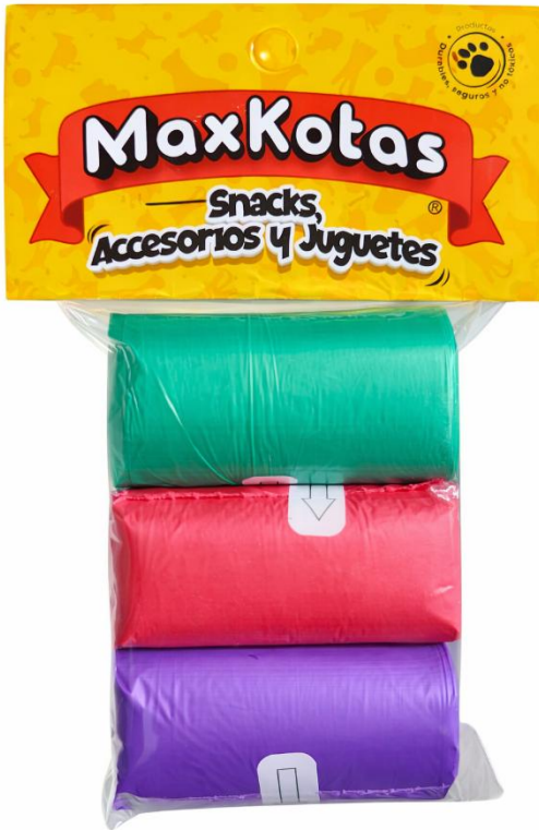
BOLSA DESECHOS MAXKOTAS 3 ROLLOS*20UD(50) 7707229247829