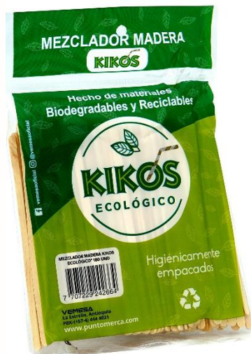
MEZCLADOR MADERA ECOLÓGICO*150UND (250) 7707229242664