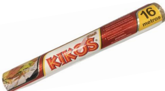
PAPEL ALUMINIO REP BOLSA*16MTS (30) 7707229245559