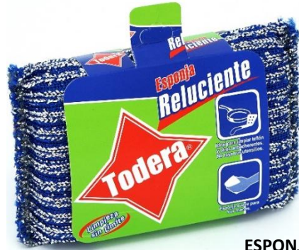
ESPONJA RELUCIENTE COMBINADA*1 (12) (72) 7707229240592