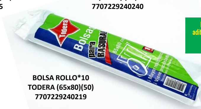
BOLSA ROLLO*10 TODERA (65x80)(50) 7707229240219

Este producto contiene aditivo Biosphere que lo hace BIODEGRADABLE de 1 a 5 años