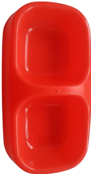
COMEDERO DOBLE GRANDE MAXKOTAS (12) 7707229241865