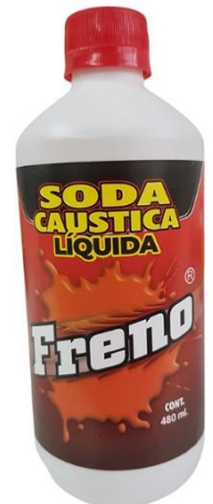
DESTAPA CAÑERIAS LÍQUIDO*480 ML(30) 7707229244002