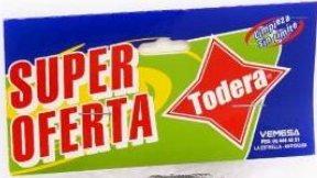
OF PE ESPONJA DORADA/PLATA+INOXIDABLE (60) 7707229242084