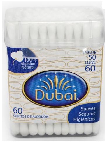
COPITO PAGUE 50 LLEVE 60 PAPEL(30) 7707229246075