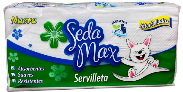
01TISS004 SERVILETA CORTADA SEDAMAX *300 (15)