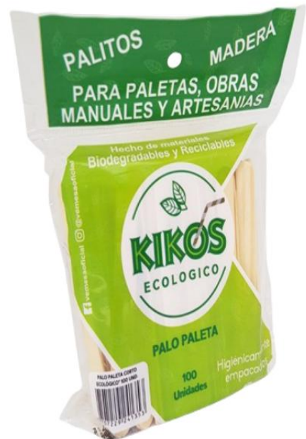
PALO PALETA CORTO NATURAL*100UND (24)(144) 7707229241353