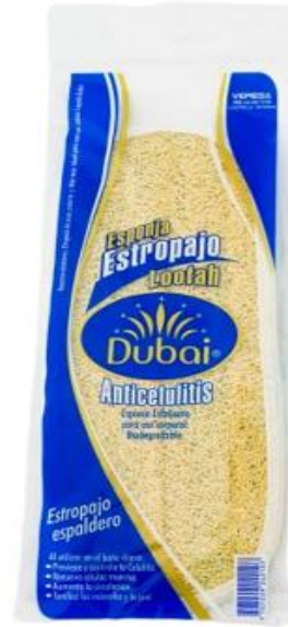
ESPALDERO ESTROPAJO- TOALLA 11X32CM (8)(120) 7707229242107