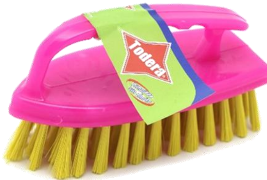
CEPILLO TIPO PLANCHA SUAVE COLORES (24) 7707229240424