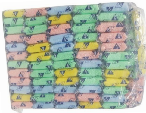
IN AND OUT PACA X 66 UDS ESPONJA COLORES 17707229242951