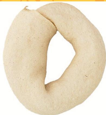
DONA CARNAZA MAXKOTAS*1 UND (12) (300) 7707229241551