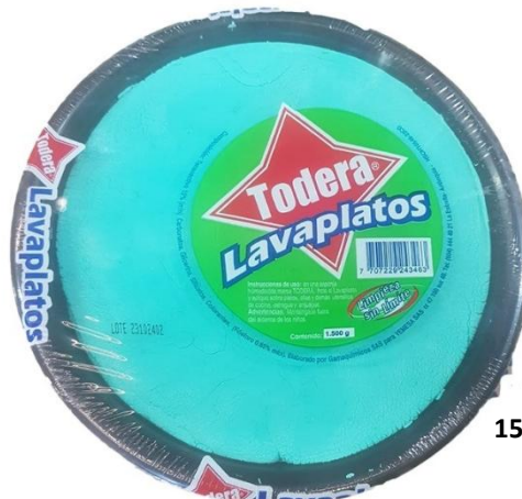
LAVAPLATOS 1500 GR ORIGINAL (12) 7707229243463