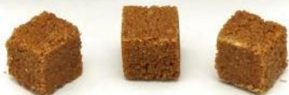
CUBO DE PANELA MARIANITO LIMÓN*24 (80) 7707229248109