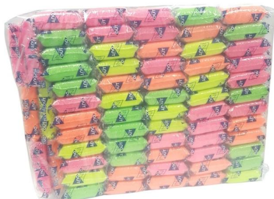
IN AND OUT PACA X 66 UDS ESPONJA TORNASOL 17707229242944