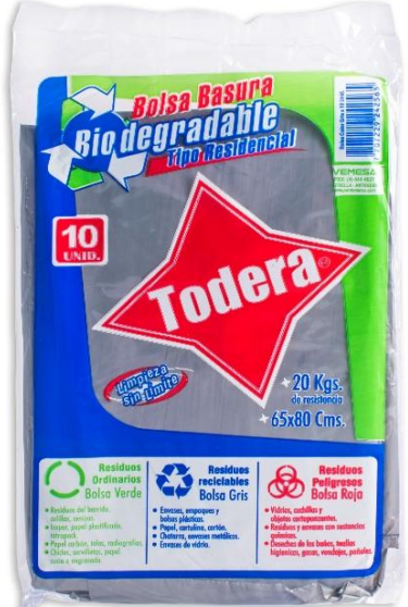
BOLSA BASURA BIODEGRADABLE GRIS*10 (65x80) (50) 7707229242565