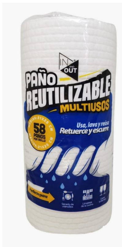
PAÑO MULTIUSOS REUTILIZABLE IN AND OUT ROLLO*58H 20X21 CM(12) 7707229249533