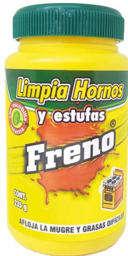
LIMPIA HORNOS*235ML (50) 7707229240721