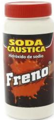
SODA CÁUSTICA ESCAMAS*300GR (16) 7707229240790