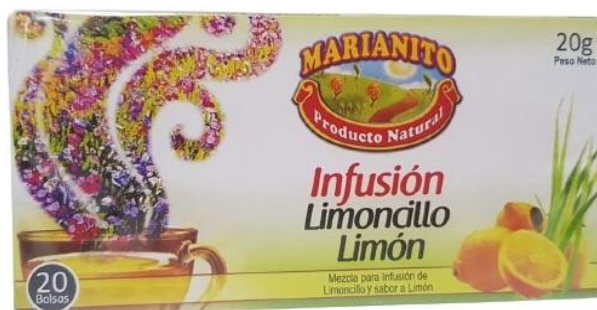
LIMONCILLO LIMÓN 20 BOLSAS (12)(288) 7707229241261