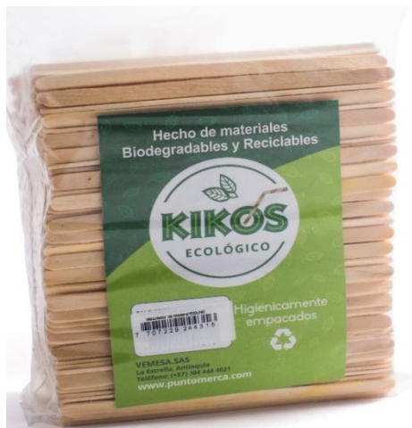
MEZCLADOR MADERA ECOLÓGICO*500UND (90) 7707229244316