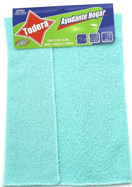
TOALLA SECADORA 35X45CM (72) 7707229242152