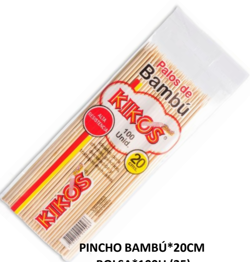
PINCHO BAMBÚ*20CM BOLSA*100U (25) 7707229245566