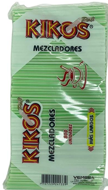
MEZCLADOR TINTO*800UND (36) 7707229241339