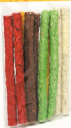
CABANOS CARNAZA MAXKOTAS *10 UND (12) (300) 7707229241568