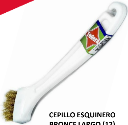
CEPILLO ESQUINERO BRONCE LARGO (12) 7707229242312