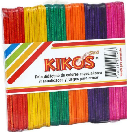
PALO PALETA COLORES LARGO*50UND (24) 7707229241483