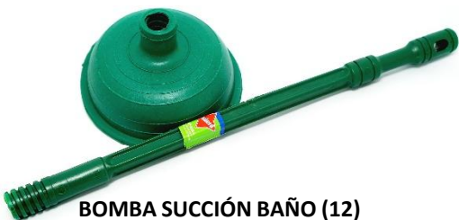
BOMBA SUCCIÓN BAÑO (12) 7707229240363