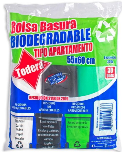
KIT BIODEGRADABLE BOLSA APARTAMENTO 55*60CM* 30 UN (20) 7707229249366