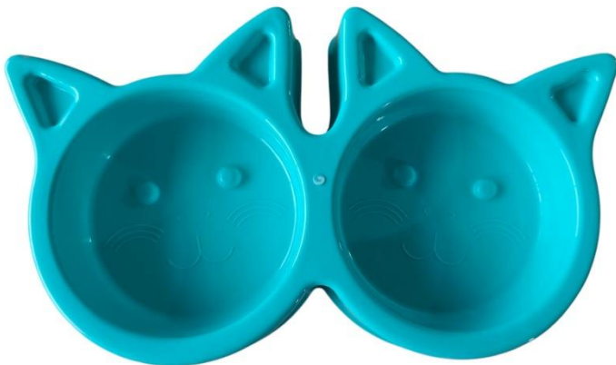
COMEDERO GATO DOBLE 7707229247973