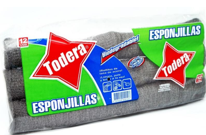
ESPONJILLA *12 UND (36) 7707229240127