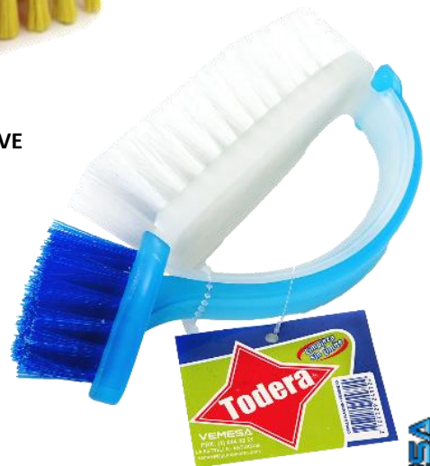
LO PLANCHA+ESQUINERO (12)(60) 7707229249724