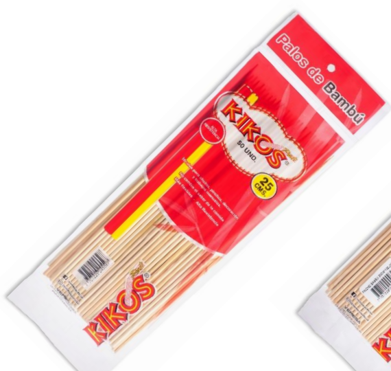
PINCHO BAMBÚ*25CM BOLSA*50UND (25) 7707229245597