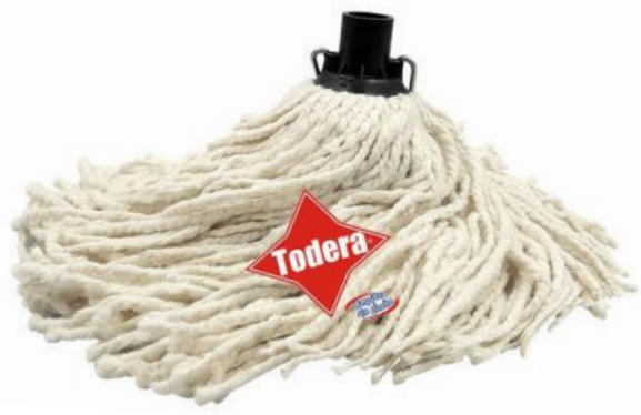
TRAPERO PABILO RPTO BLANCO* 250GR (12) 7707229242930