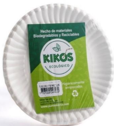
PLATO DE PAPEL #15 PANDO *12UND (24) 7707229247584