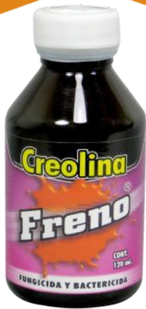
CREOLINA*120CC (25) 7707229240738