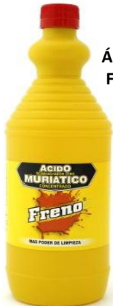
ÁCIDO SIN MURIÁTICO FRENO *1000 ML (12) 7707229240714