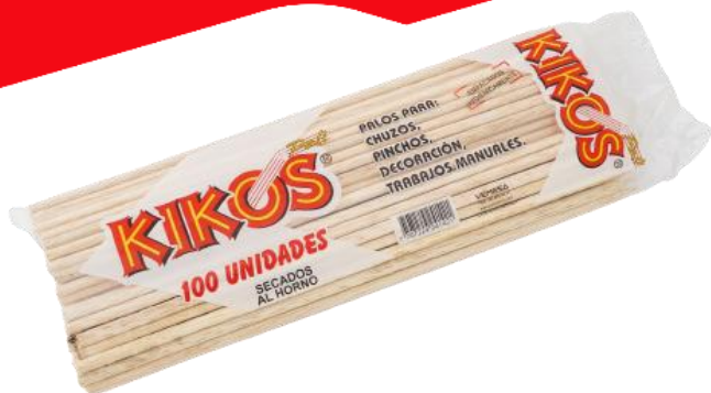
PALO CHUZO BAMBÚ 5mm X 28 CM BOLSA*100UND (24) 7707229241421