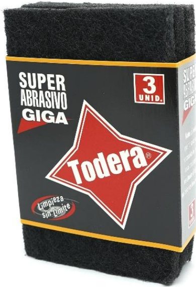
ESPONJA NEGRITA GIGA*3UND (60) 7707229242466