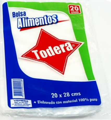
BOLSA ALIMENTOS 20CMX28CM*20UD (50) 7707229244248