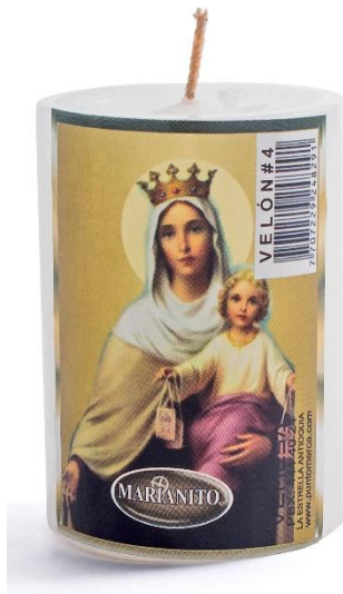
VELÓN*200 GR #4 8X 5,8 CM (25) 7707229248291