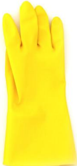
GUANTE DOMÉSTICO ESPECIAL

T. 7 7707229240660 T. 8 7707229244477 T. 9 7707229247225