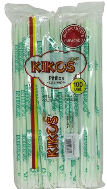
PITILLO ENVUELTO EXT 5.5mm*100UND (100) 7707229245740