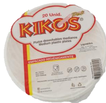
PLATO DESECHABLE 15.5CM *20 UND (60) 7707229242510