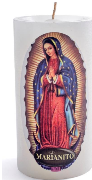
VELÓN*283GR #6 13X 5,8 CM (25) 7707229240271