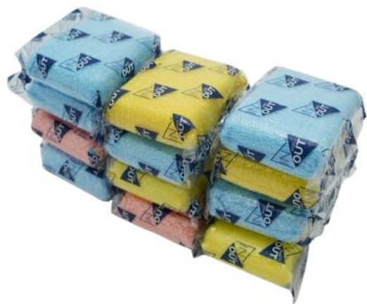
IN AND OUT PACA X 12 UD ESPONJA COLORES 107707229243057