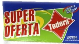
OF PE ESPONJA MALLA BLANCA+POLIETILENO (60) 7707229242695