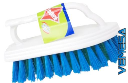
CEPILLO TIPO PLANCHA SUAVE (24) 7707229242589