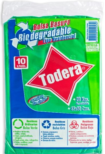
BOLSA BASURA BIODEGRADABLE VERDE*10 (65x80) (50) 7707229242572