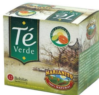
TÉ VERDE-FRUTOS CÍTRICOS*12 BOLSAS (12)(288) 7707229245313