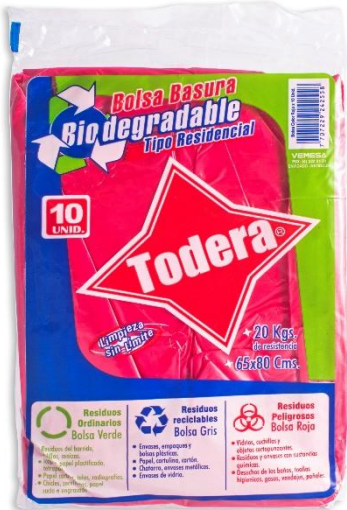
BOLSA BASURA BIODEGRADABLE ROJA*10 (65x80) (50) 7707229242558