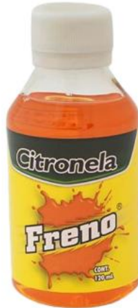
ACEITE CITRONELA *120CC (30) 7707229240752