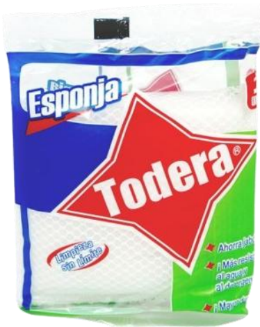
ESPONJA MALLA *1UND (10)(60) 7707229240035