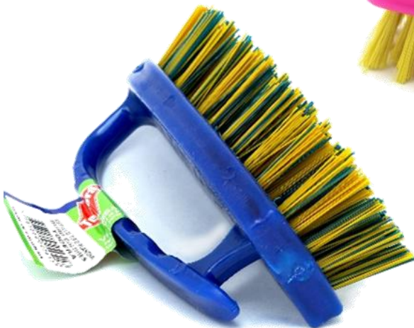
CEPILLO TIPO PLANCHA DI COLORES (24) 7707229240417