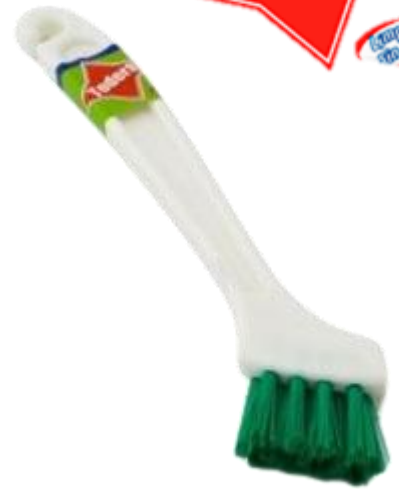
CEPILLO ESQUINERO FIBRA LARGO (12) 7707229242329