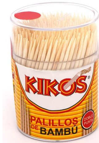
PALILLO BAMBÚ DOBLE PUNTA TARRO*360UND (24)(288) 7707229245603