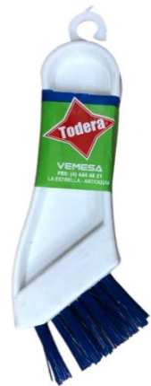
CEPILLO ESQUINERO FIBRA CORTO (12) 7707229242336