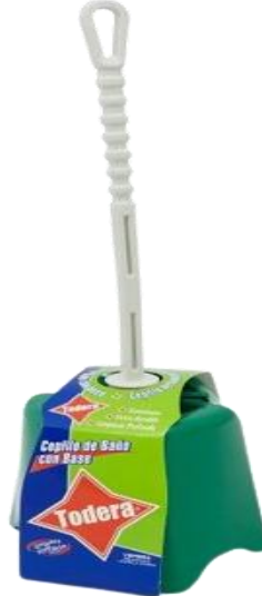
CEPILLO SANITARIO BASE COLOR (12)(48) 7707229249700