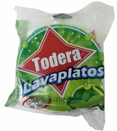
LAVAPLATOS DISCO*150GR (120) 229242923