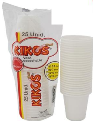
VASO DESECHABLE TINTERO 3.3oz KIKOS*25UND (120) 7707229241537