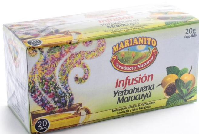
INFUSIÓN YERBABUENA MARACUYÁ 20 BOLSAS (12)(288) 7707229244927