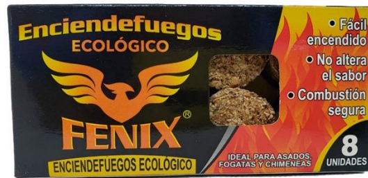
ENCIENDE FUEGOS FENIX ECOLÓGICO *8UND (72) 7707229246525