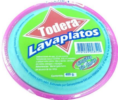
LAVAPLATOS 400GR ORIGINAL (36) 7707229240042