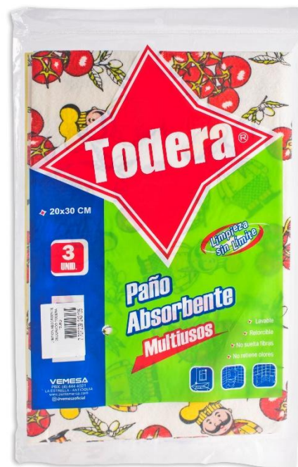
LIMPIÓN ABSORBENTE *3 UND DECORADO (24) 7707229243135