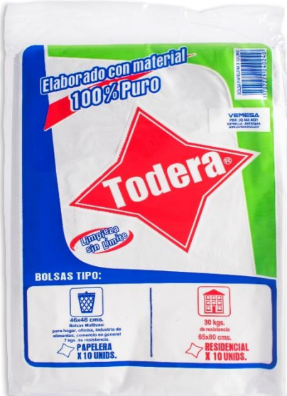
BOLSA PAPELERA*10 (46x46) (50) 7707229240240