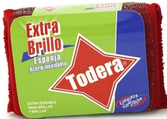
ESPONJA EXTRABRILLO *1 (12) (36) 7707229242169