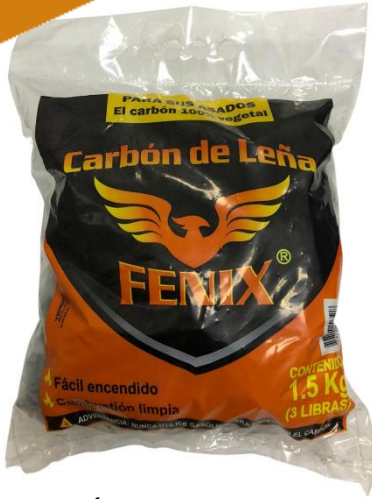
CARBÓN FENIX*3 LIBRAS (1.5 KL)(12) 7707229246518