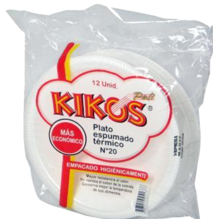
PLATO ESPUMADO #20 PANDO*12UND (30) 7707229241377