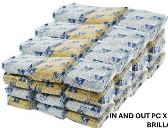
IN AND OUT PC X 48UD ESPONJA BRILLANTE 17707229247963