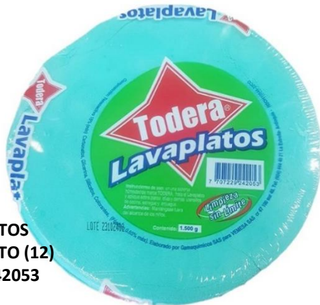
LAVAPLATOS *1500 gr RPTO (12) 7707229242053