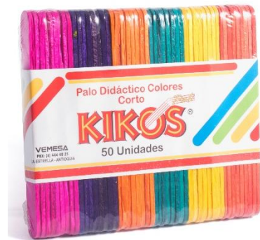
PALO PALETA COLORES CORTO*50UND (24) 7707229241490