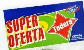
OF PE ESPONJA POLIETILENO*1+INOXIDABLE (60) 7707229242077