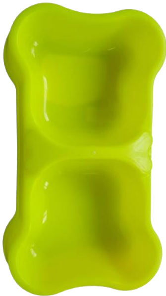
COMEDERO HUESO DOBLE MINI MAXKOTAS (12) 7707229246259