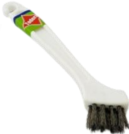
CEPILLO ESQUINERO LARGO ACERO INOXIDABLE (12) 7707229242312