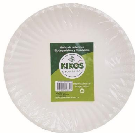
PLATO DE PAPEL #23 PANDO*12UND (24) 7707229243746