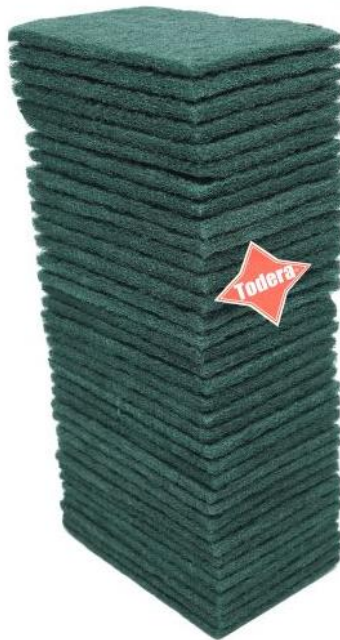
DISPLAY *36 UND PAÑO ABRASIVO VERDE (9) 17707229242029