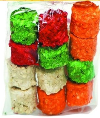
COQUITOS CARNAZA MAXKOTAS *12 UND (12) (240) 7707229241582