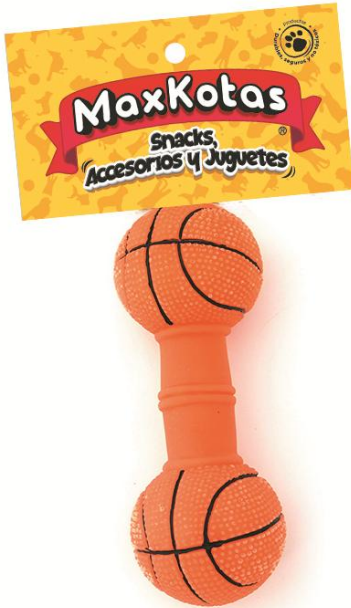
JUGUETE VINILO MAXKOTAS PEQUEÑO (12) 7707229241841