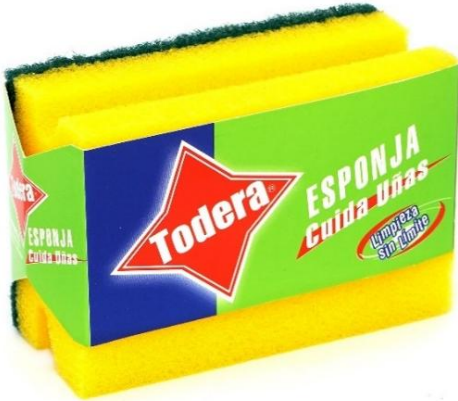
ESPONJA CUIDA UÑAS (10) (60) 7707229240493