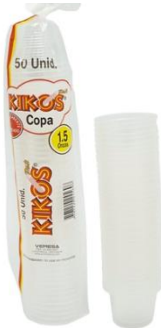
COPA AGUARDIENTERA 1.5oz KIKOS*50UND (80) 7707229245696