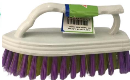
CEPILLO TIPO PLANCHA DURO (24) 7707229240394