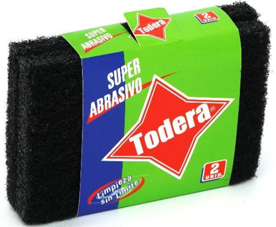
ESPONJA NEGRITA *2 UND (60) 7707229240387