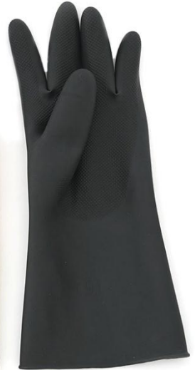
GUANTE SEMIINDUSTRIAL C-20 (12) (144)

T7 7707229240431 T8 7707229240448 T9 7707229240455