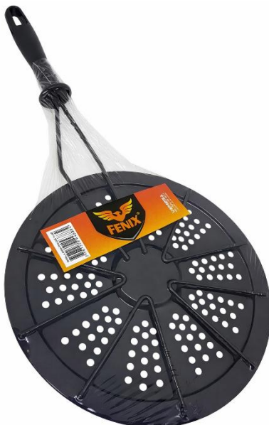
PARRILLA AREPA GAS*1UND (20) 7707229246884