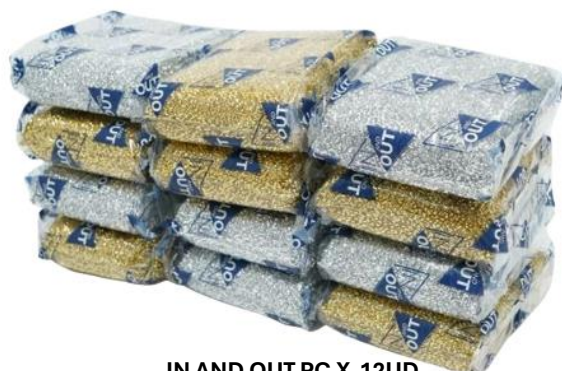
IN AND OUT PC X 12UD ESPONJA BRILLANTE 1770722943033