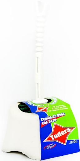
CEPILLO SANITARIO CON BASE(12)(48) 7707229240349