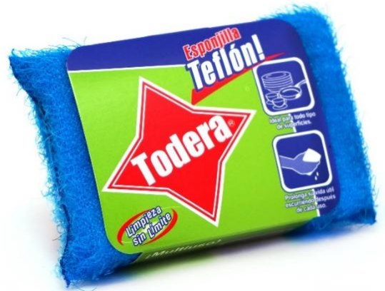
ESPONJA TEFLÓN*1 (12) (72) 7707229240165