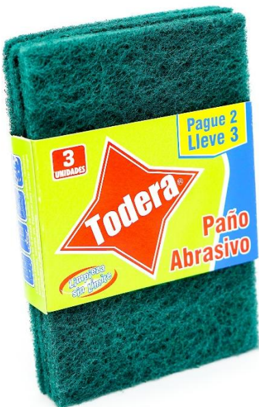
PAÑO TODERA ABRASIVO PAGUE 2 LLEVE 3 (48) 7707229240325