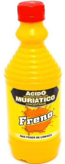
ÁCIDO SIN MURIÁTICO*480ML (24) 7707229240707