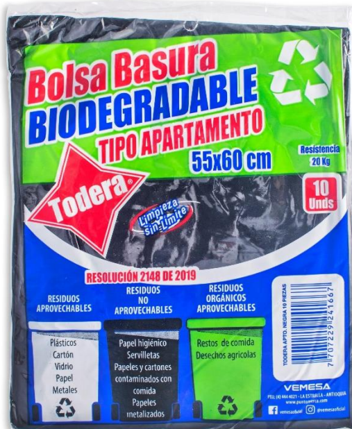
BOLSA BIODEGRADABLE APARTAMENTO 55*60CM NEGRA*10(50) 7707229241667