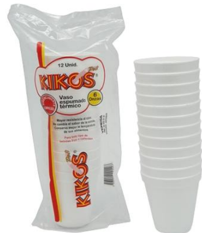
VASO ESPUMADO 6oz*12UND (60) 7707229241407