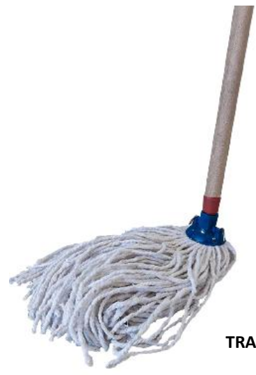
TRAPERO PABILO 250 GR + CABO (12) 7707229247379