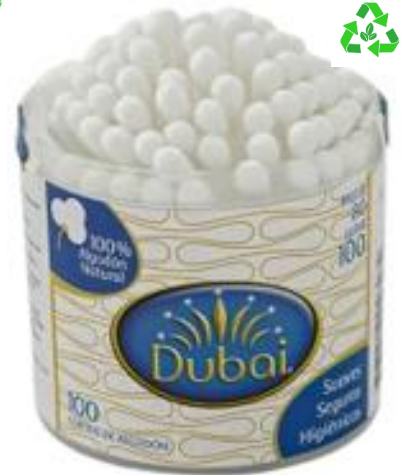
COPITO PAGUE 80 LLEVE 100 PAPEL (12) 7707229246082