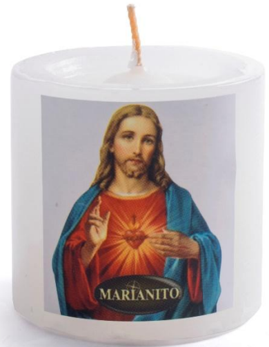
VELÓN*150GR #3 5,5x5,8CM (50) 7707229244637