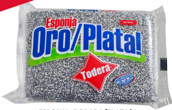
ESPONJA DORADA/PLATA*1 (12) (72)