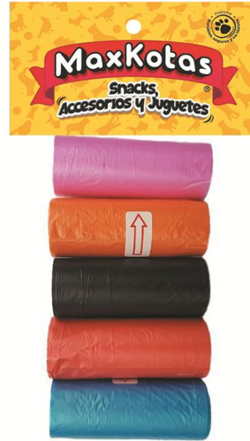
BOLSA DESECHOS MAXKOTAS*5UND 15 BLS (50) 7707229412418