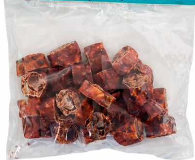
CÁBANO DE GATO *25GR (24) 7707229244101