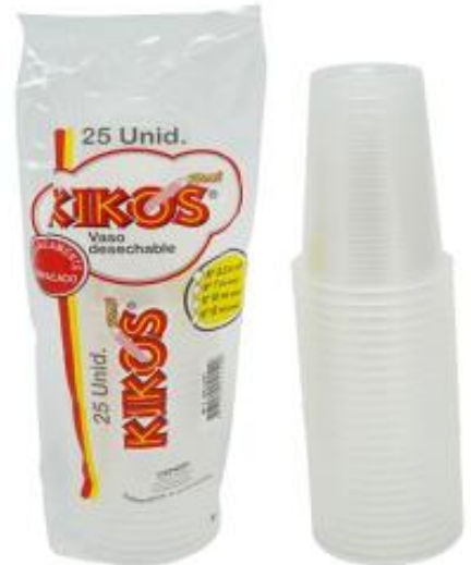
VASO DESECHABLE 7oz KIKOS*25UND (100) 7707229241520