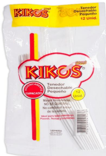
TENEDOR*12UDS DESECHABLE PEQUEÑO (50) 7707229241476