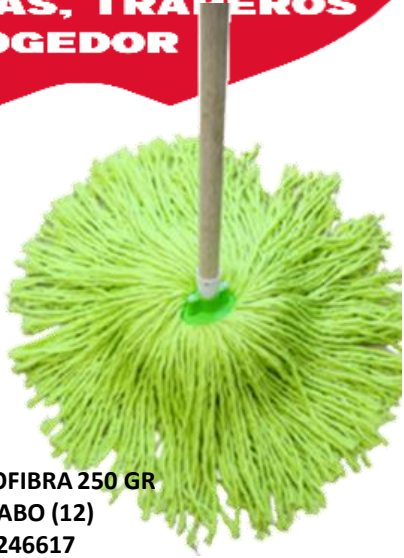
TRAPERO MICROFIBRA 250 GR COLOR + CABO (12) 7707229246617