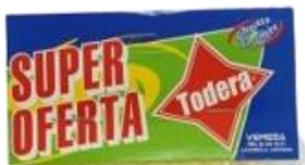
OF ESPONJA CUIDA UÑAS+ARCOIRIS(60) 7707229246273