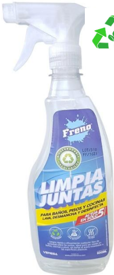
LIMPIA JUNTAS*500 ML (24) 7707229247119