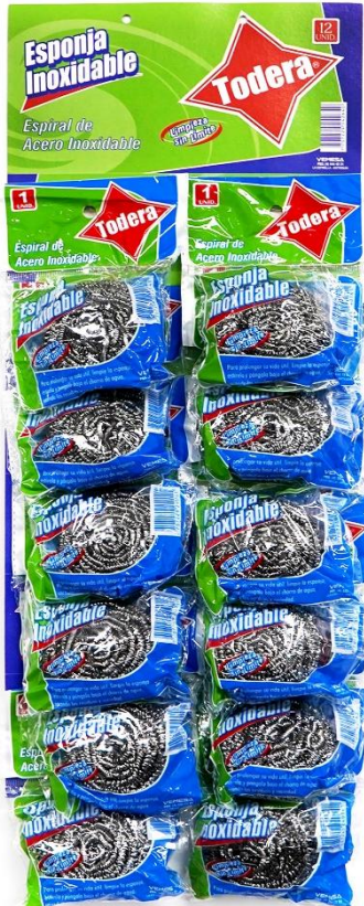
RISTRA ESPONJA INOXIDABLE*12UND (24) 7707229242640