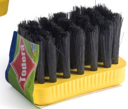
CEPILLO BETUNERO PEQUEÑO TODERA (12) 7707229242299