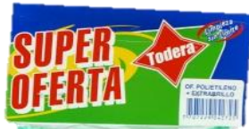
OF PE ESPONJA POLIET+ESPONJA EXTRABRILLO (24) 7707229242725