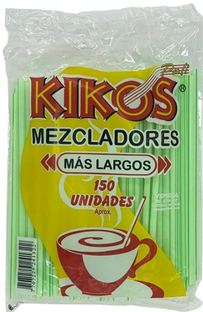
MEZCLADOR TINTO*150UND (36) 7707229241322