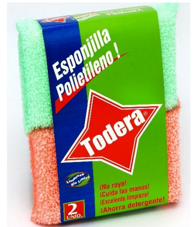
ESPONJA POLIETILENO *2 (6) (36) 7707229240172