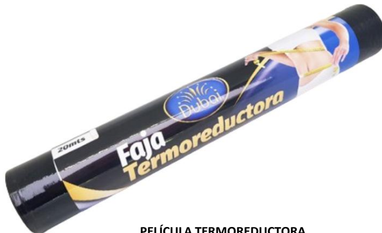
PELÍCULA TERMOREDUCTORA DUBAI*20 MTS (40) 7707229246044