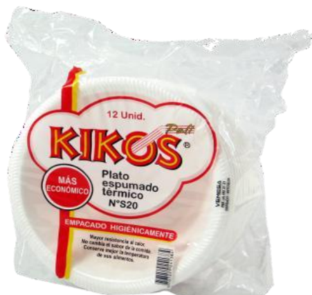
PLATO ESPUMADO #20 HONDO*12UND (20) 7707229241384