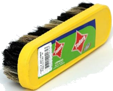
CEPILLO BETUNERO GRANDE TODERA(12) 7707229242343