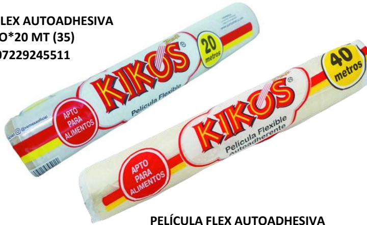
PELÍCULA FLEX AUTOADHESIVA RPTO*40 MT(30) 7707229243418