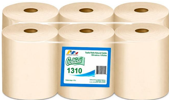
01TISS002 TOALLA EN ROLLO NATURAL 100MT*6