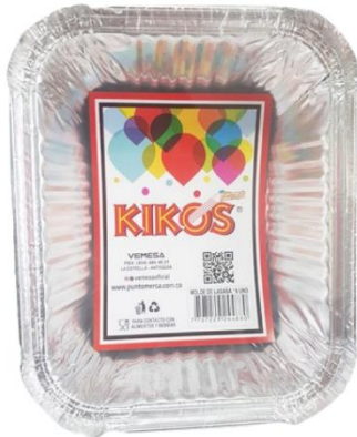
MOLDE LASAÑA 16 ONZ*6 UND (12) 7707229244880