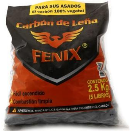
CARBÓN FENIX*5 LIBRAS (2.5 KL)(6) 7707229246501