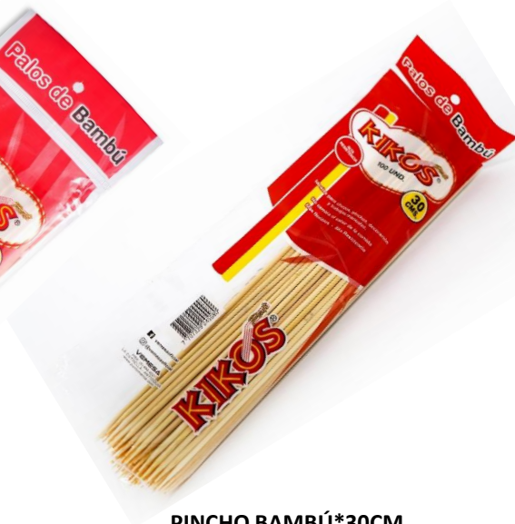
PINCHO BAMBÚ*30CM BOLSA*100UND (25) 7707229245580