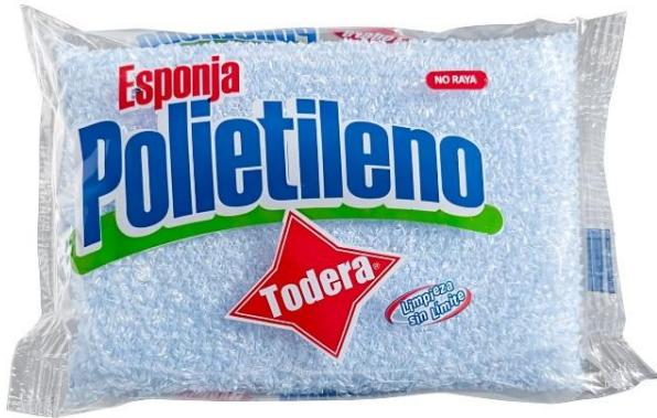
ESPONJA POLIETILENO*1 (12) (72) 7707229240189