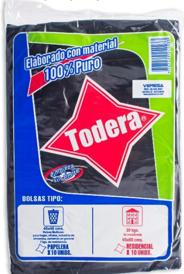
BOLSA RESIDENCIA*10 (65x80)(50) 7707229240233