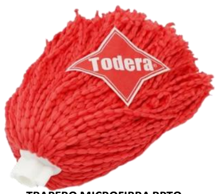
TRAPERO MICROFIBRA RPTO COLORES 250 GR (12) 7707229243241