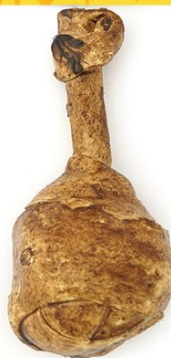
PERNIL POLLO CARNAZA MAXKOTAS*1 UND (12) (300) 7707229247294