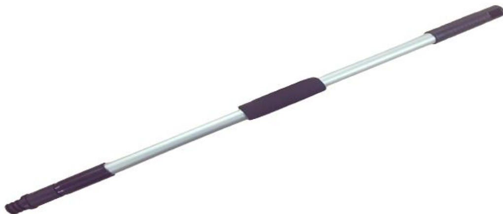
LIMPIAVIDRIOS METAL EXTENSIBLE (30) 7707229249731