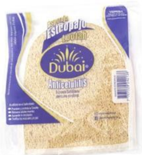
GUANTE ESTROPAJO – TOALLA 14X18CM (20) (200) 7707229242138