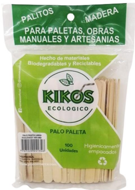
PALO PALETA LARGO NATURAL*100UND (24)(120) 7707229241346