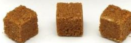
CUBO PANELA MARIANITO CANELA*24 (80) 7707229245177