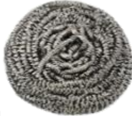
ESPONJA TODERA INOXIDABLE *1UND[(24) (720) 7707229240141