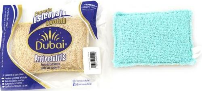
ESTROPAJO TELA TOALLA RECTANGULAR 9.5X2CM (10)(120) 7707229242114