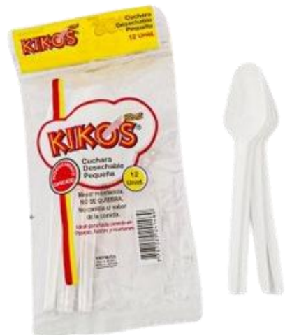
CUCHARA*12UDS DESECHABLE PEQUEÑA (50) 7707229241469