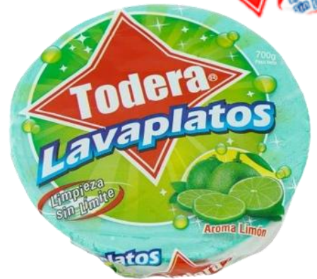
LAVAPLATOS *700gr REPUESTO AROMA LIMÓN (24) 7707229242909