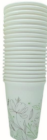
VASO CARTÓN ECOLÓGICO 6OZ*20UND (40) 7707229249335