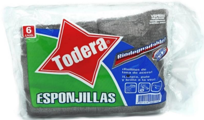
ESPONJILLA *6 UND (72) 7707229240110