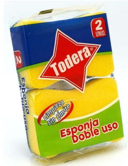
ESPONJA DOBLE USO *2 UNID (7) (42) 7707229240301