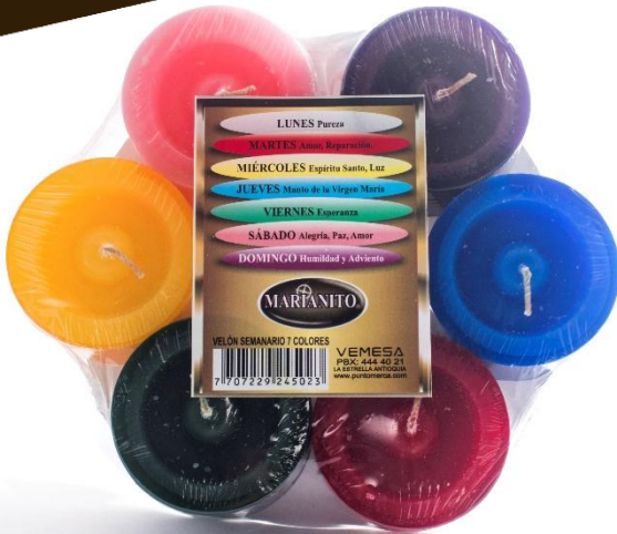
VELÓN SEMANARIO COLORES*7 UND 3,5 x5,8 CM(10) 7707229245023