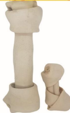
HUESO MAXKOTAS H-7 GRATIS HUESO (20) 7707229246402